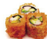
California Roll Deluxe Surimi, Avocado & Gurke, mit Fliegenfischkaviar 6,80 €