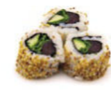
Salata Tekka Thunfisch, Rucola & Gurke, mit Sesam 5,20 €